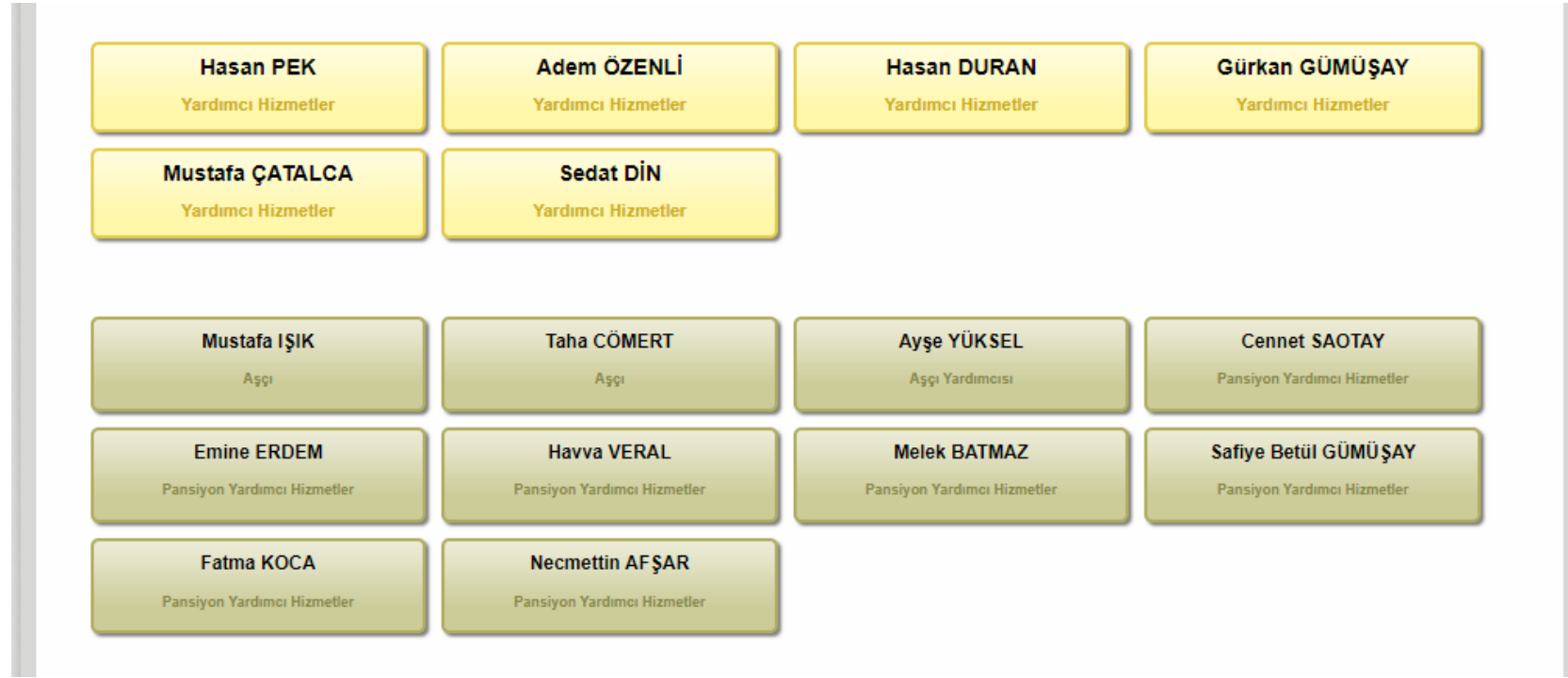
Şekil 1: Organizasyon Şeması